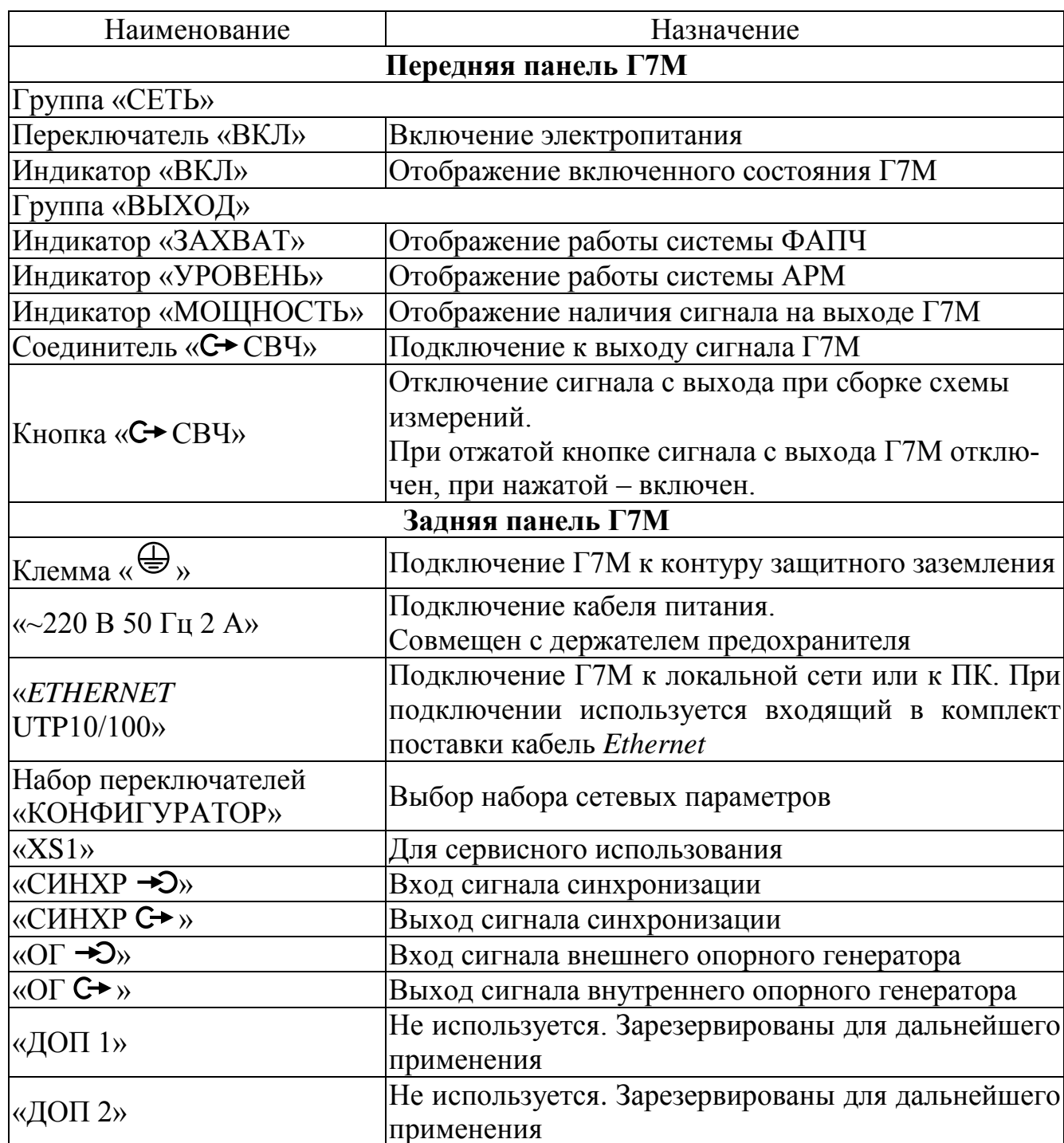
Т а б л и ц а 7.1 – Описание органов управления и поясняющих надписей

Внешний вид, расположение органов управления и поясняющих надписей на передней и задней панелях Г7М приведены на рисунках 7.1 – 7.2.