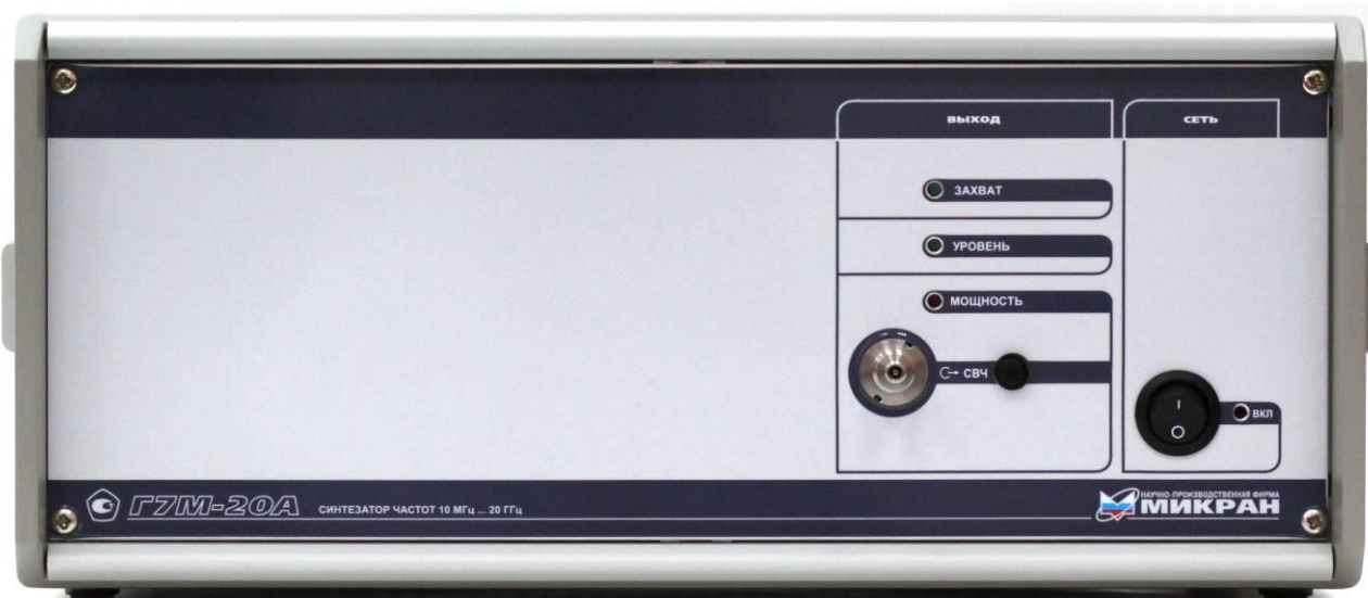
Рисунок 7.1 – Внешний вид передней панели Г7М