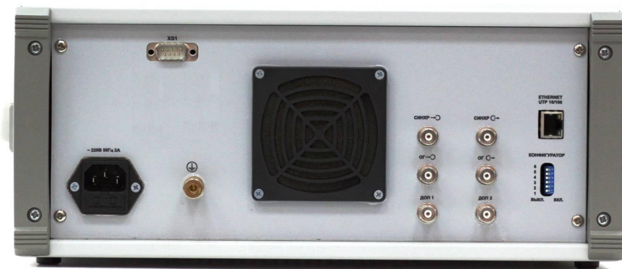
Рисунок 7.2 – Внешний вид задней панели Г7М